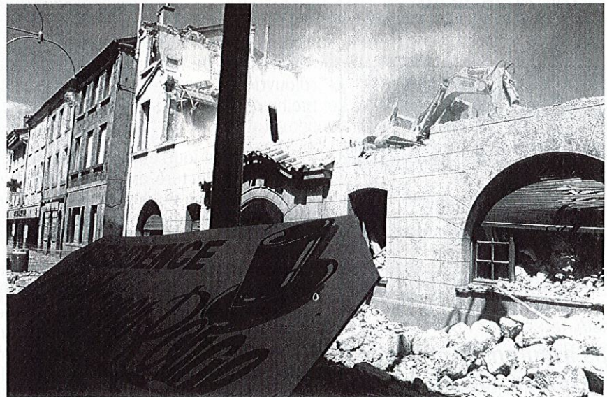
Sur la Route Bleue, le "Chapeau Rouge" n'est plus...

(1) Cf. "Le Petit Forézien" n° 10, décembre 1990.