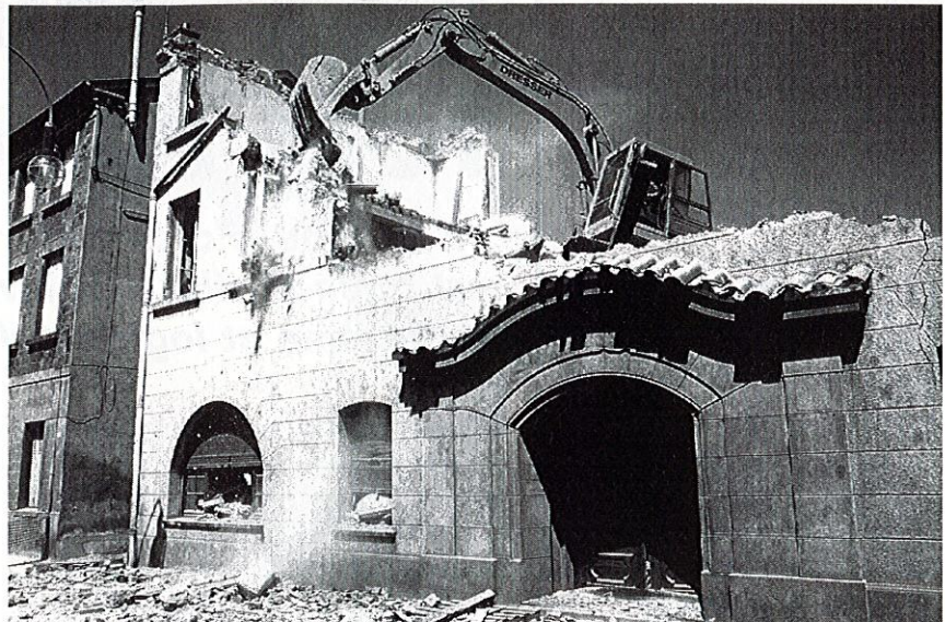
La façade principale tombe sous les coups de la pelleteuse

Sur la Route Bleue, les nostalgiques du "Chapeau Rouge" ne verront plus le restaurant dans lequel ils ont dégusté et apprécié les grenouilles des étangs du roy, l'omble chevalier au beurre moussieux sans oublier le fameux gratin forézien... A la place va s'élever une résidence, baptisée bien naturellement "Le Chapeau Rouge", comportant vingt-cinq logements (deux bâtiments de quatre et cinq étages) et des locaux commerciaux, au rez-de-chaussée.